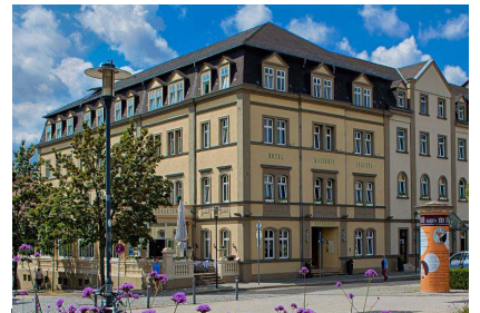
Hotel Kaiserin Augusta Carl-August-Allee 17 99423 Weimar