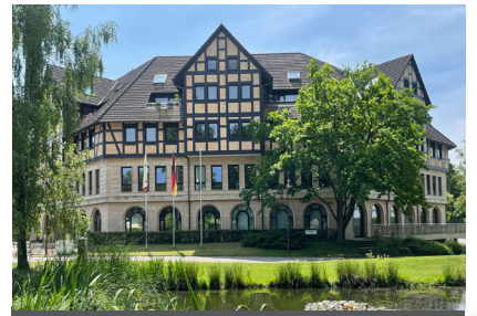
Hotel Rabenstein Empfang Residenzpark 7 19065 Raben Steinfeld