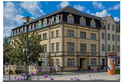
Hotel Kaiserin Augusta Carl-August-Allee 17 99423 Weimar